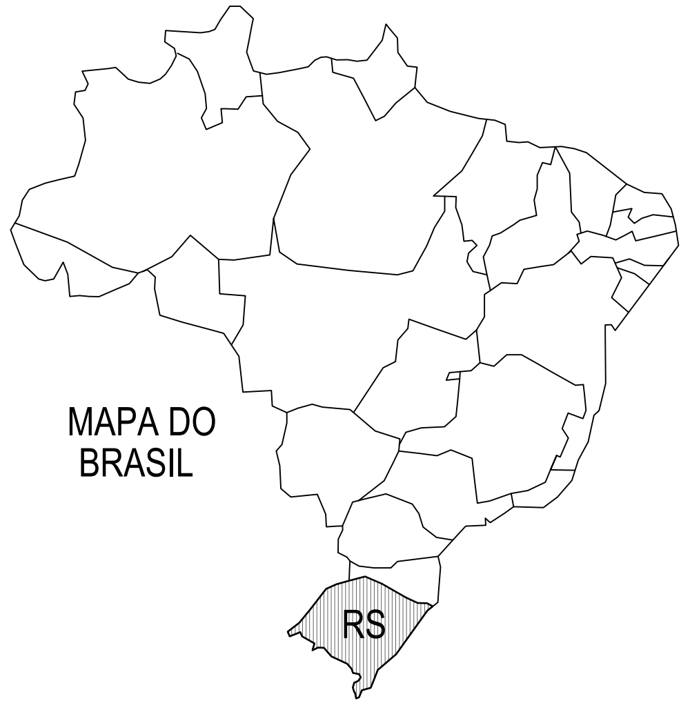
MAPA DO BRASIL