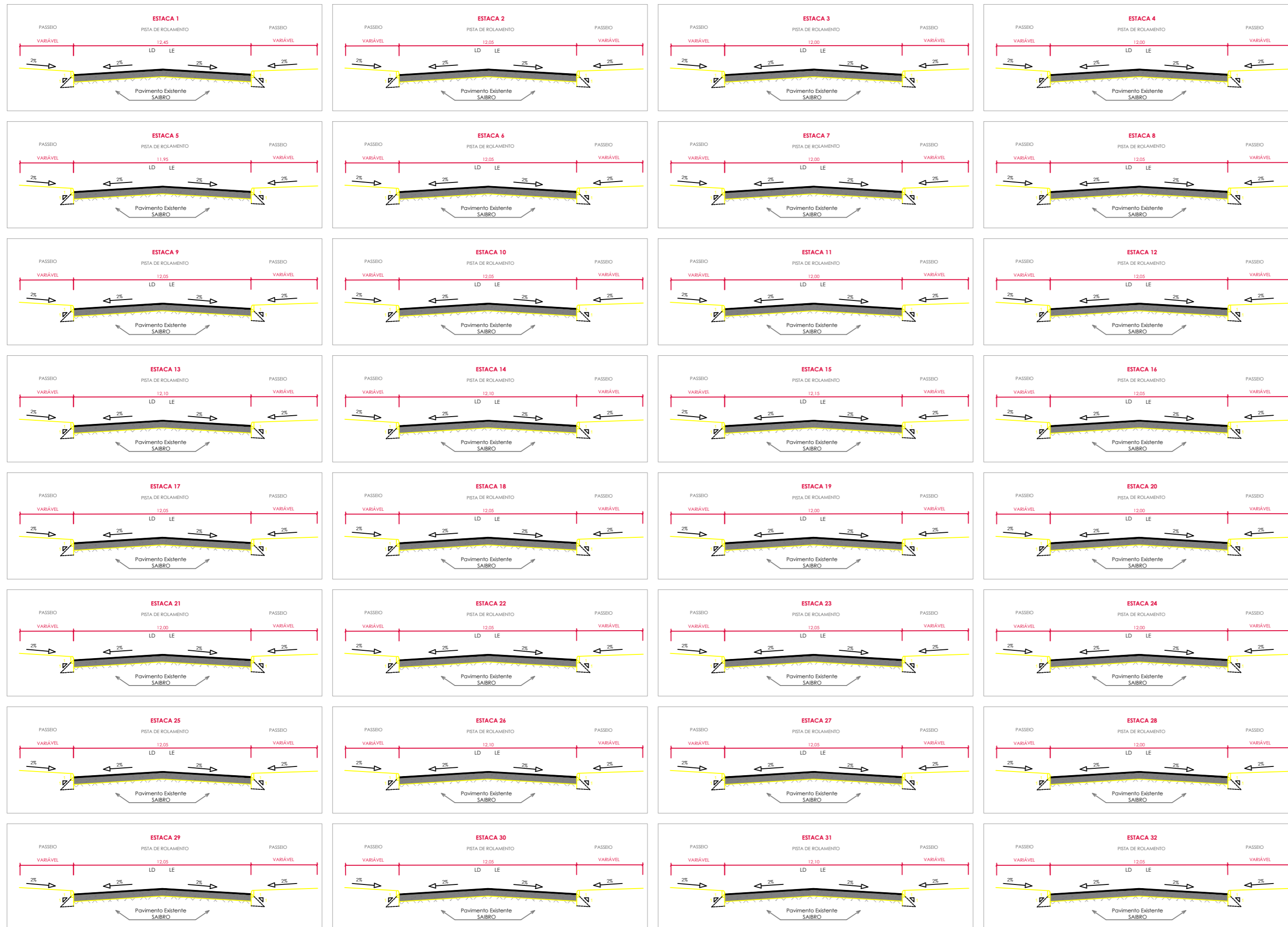
DETALHAMENTO 04 | PERFIL DA VIA SEM ESCALA