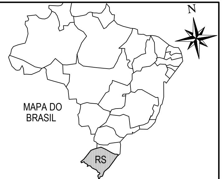
MAPA DO BRASIL