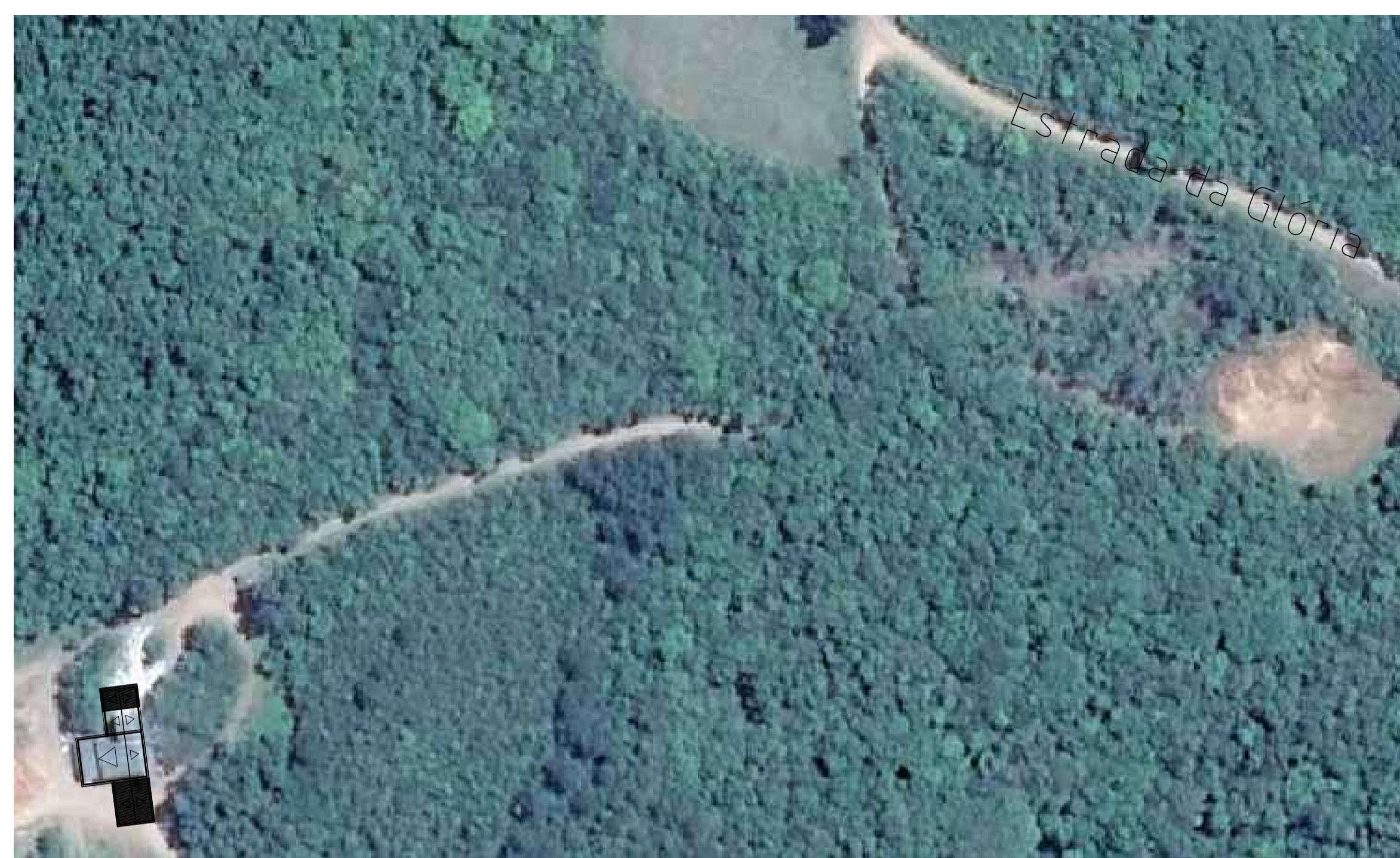
SITOLocalização Esc: 1/1200